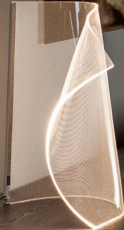
Table lamp made up of a sheet of molded micro-printed methacrylate and a chrome metal edge.

Lámpara de sobremesa formada por una lámina de metacrilato microimpreso moldeado y perfil metálico cromo.